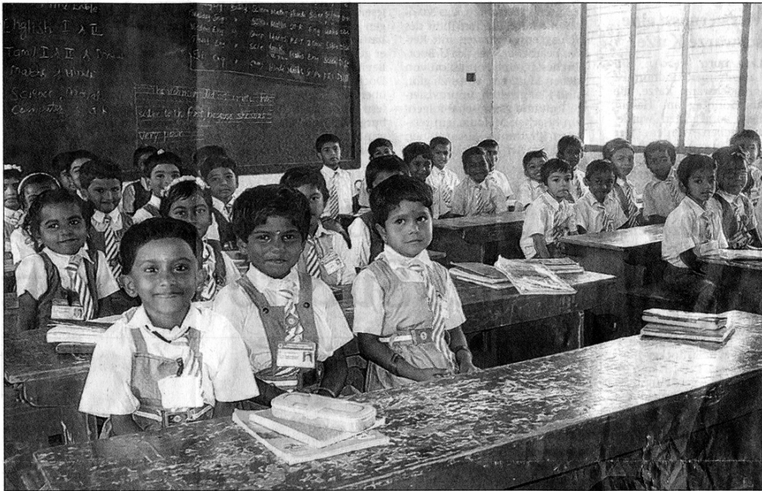
Ohne die Paten aus der Gemeinschaft Sahms wäre der Schulbesuch für diese Kinder nicht denkbar.